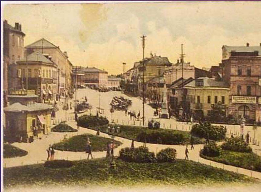
Площа Трьох Комунарів – Павлівський майдан