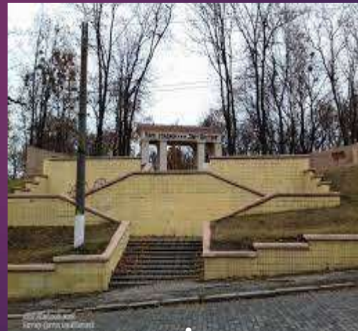
Сад паризьких комунарів– Карповський сад