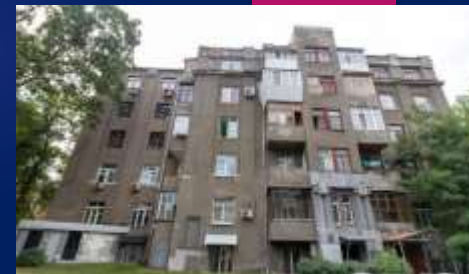
вулиця Культури , Будинок Слова