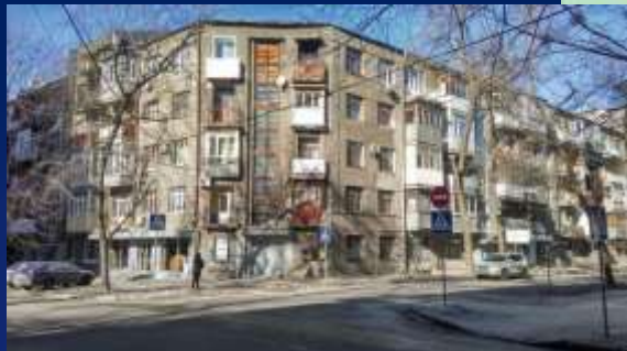
вулиця Миколи Хвильового