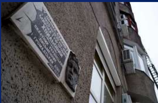
вулиця Римарська, 19