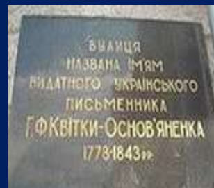
вулиця Г. Квітки - Основ'яненка