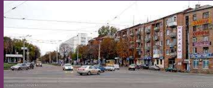
Площа Повстання – площа Захисників України