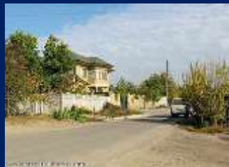
вулиця Миколи Куліша