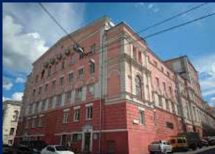
вулиця Римарська , Театр «Березиль»